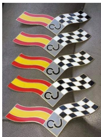
Insignias Circuito del Jarama con tornillo o planas