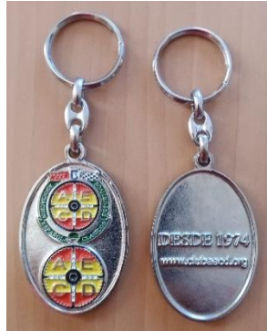
Llavero con logotipos de la AECD Cultural y Deportiva