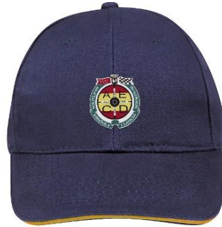
Gorra bordada con logotipo, en marino y beige