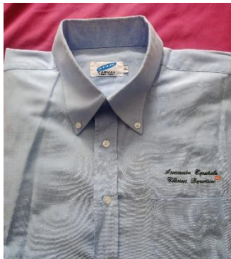
Camisa Oxford manga larga bordada con texto y bandera