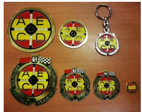
Insignias grandes en latón esmaltado 20 €