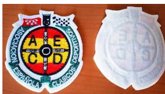
Galleta bordada termoadhesiva para chaquetas, anoracks, etc.