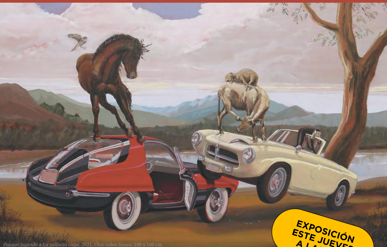
Pegasos jugando a La gallinita ciega, 2021. Óleo sobre lienzo. 100 x 160 cm.