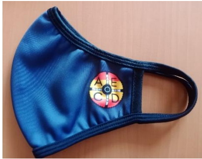
Mascarilla con logotipos de la AECD Cultural y Deportiva

Ponemos a disposición de todos nuestros socios y seguidores un amplio catálogo de productos personalizados de la AECD